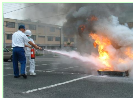
< 消火器による消火訓練 >