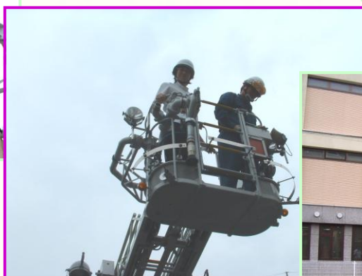
< はしご車による脱出訓練 >