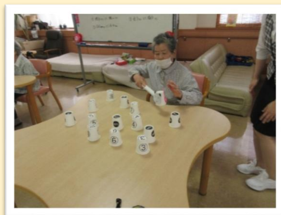
↑紙コップでモグラたたきゲーム！