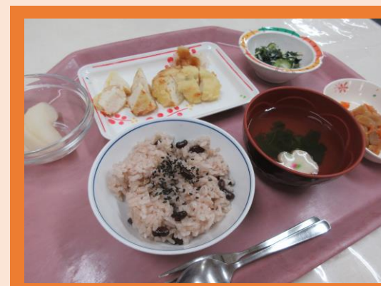
敬老の日にちなんで、お赤飯のメニューです！