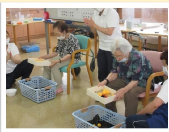
↑ピンポン玉落とし

7月下旬、1週間にわたってデイケア運動会を開催しました！ 1種目を2日ずつ、3種目実施し、多くのご利用者様にそれぞれのゲームを楽しんでいただきました。