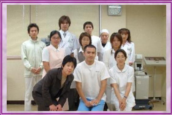
私たちが広報委員会です